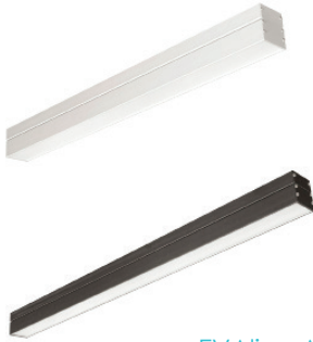
>> EVAline Aqua HE armatuur

EVA Optic is specialistisch ontwikkelaar van hoge kwaliteit LED oplossingen voor zwembaden en indoor sportfaciliteiten. Alle producten worden in Nederland in eigen huis ontwikkeld en geproduceerd.