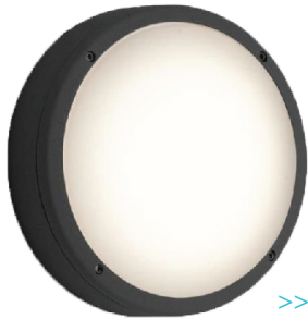
>> EVA Astro Wandarmatuur

EVA Optic is specialistisch ontwikkelaar van hoge kwaliteit LED oplossingen voor veeleisende omgevingen. Alle producten worden in Nederland in eigen huis ontwikkeld en geproduceerd.