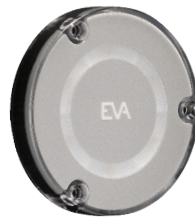
>> EVA R6