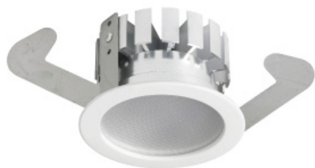
>> EVA DL Mini

EVA Optic is specialistisch ontwikkelaar van hoge kwaliteit LED oplossingen voor veeleisende omgevingen. Alle producten worden in Nederland in eigen huis ontwikkeld en geproduceerd.