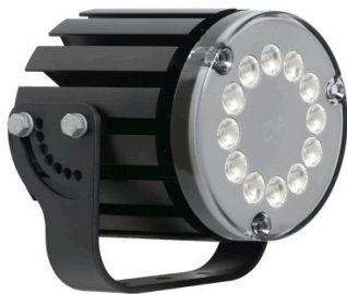
>> EVA Hydra met kantelbeugel

EVA Optic is specialistisch ontwikkelaar van hoge kwaliteit LED oplossingen voor zwembaden en indoor sportfaciliteiten. Alle producten worden in Nederland in eigen huis ontwikkeld en geproduceerd.