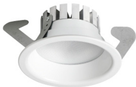
>> EVA DL Leda

EVA Optic is specialistisch ontwikkelaar van hoge kwaliteit LED oplossingen voor veeleisende omgevingen. Alle producten worden in Nederland in eigen huis ontwikkeld en geproduceerd.