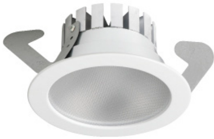
>> EVA DL

EVA Optic is specialistisch ontwikkelaar van hoge kwaliteit LED oplossingen voor veeleisende omgevingen. Alle producten worden in Nederland in eigen huis ontwikkeld en geproduceerd.