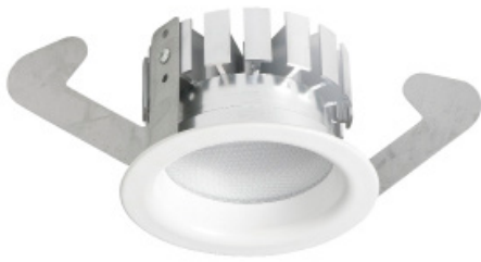
>> EVA DL Lemi

EVA Optic is specialistisch ontwikkelaar van hoge kwaliteit LED oplossingen voor veeleisende omgevingen. Alle producten worden in Nederland in eigen huis ontwikkeld en geproduceerd.